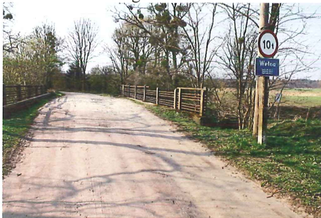
Most na Wełnie - jedyny wyjazd w stronę drogi DW178